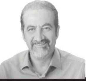
Genel Cerrahi Uzmanı İstanbul Tabip Odası Genel Sekreteri