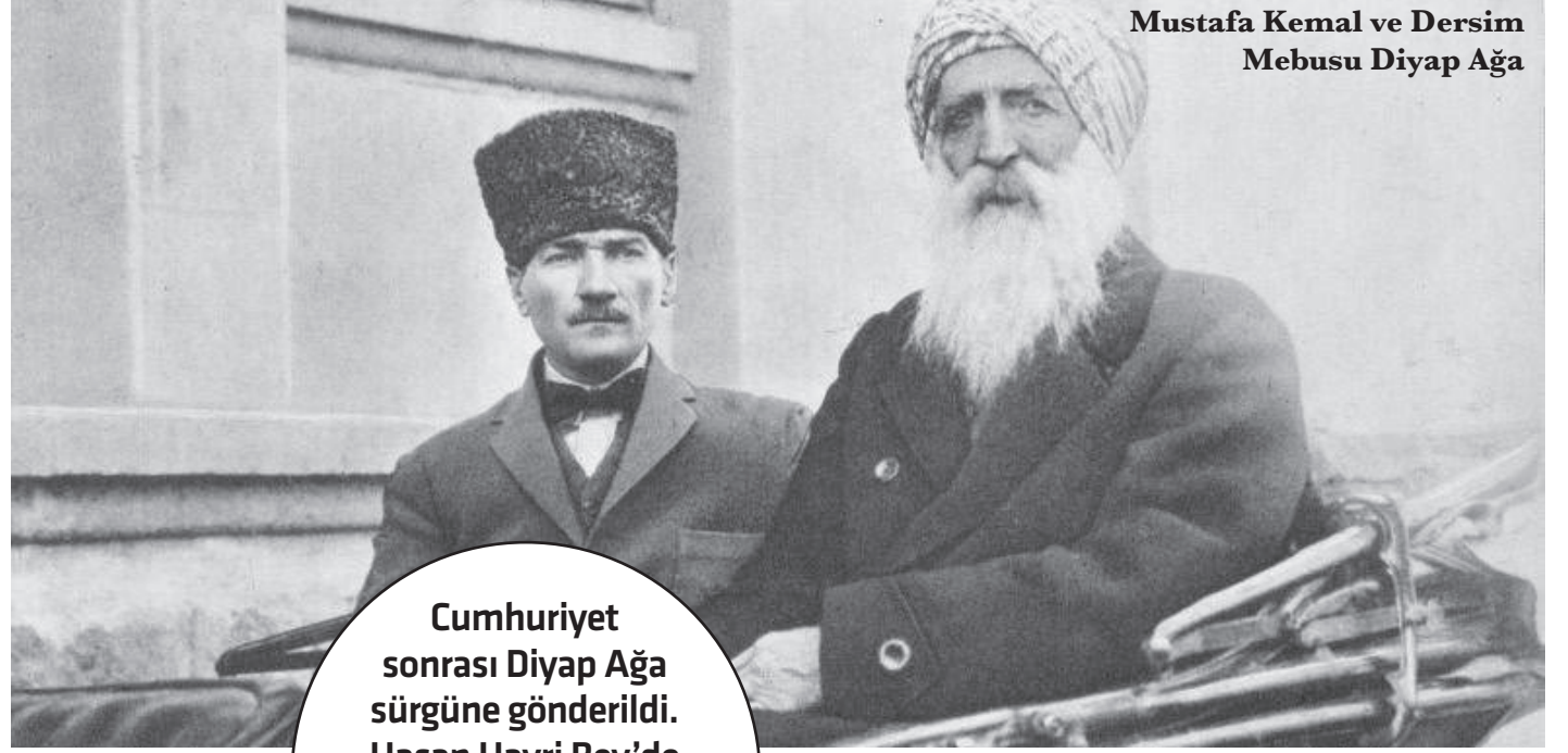
Mustafa Kemal ve Dersim Mebusu Diyar Ağa

Cumhuriyet sonrası Diyar Ağa sürgüne gönderildi. Hasan Hayri Bey'de Kürt kıyafeti ile Meclis'e gelmesinin bedelini 1925'de idam edilerek ödedi