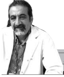
Genel Cerrahi Uzmanı İstanbul Tabip Odası Divan Başkanı