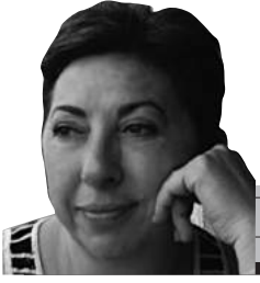
ANAP Eski Genel Başkanı İktisatçı