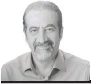
Genel Cerrahi Uzmanı İstanbul Tabip Odası Genel Sekreteri