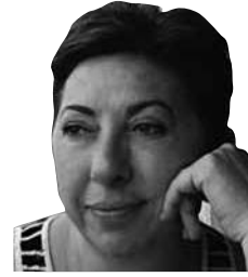
ANAP Eski Genel Başkanı İktisatçı