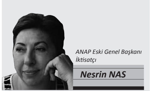
ANAP Eski Genel Başkanı İktisatçı

Ne yazık ki, sivil toplum güçlenmeden, siyasetin ve örgütlenmenin önündeki engeller kalkmadan, temel hak ve özgürlüklerin sınırlandırılmayacağı