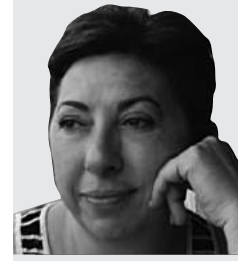
ANAP Eski Genel Başkanı İktisatçı