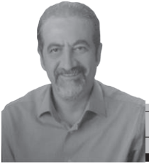
Genel Cerrahi Uzmanı İstanbul Tabip Odası Divan Başkanı