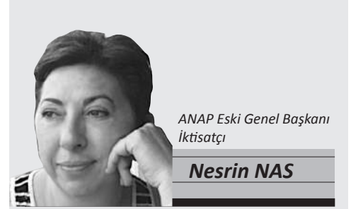
ANAP Eski Genel Başkanı İktisatçı