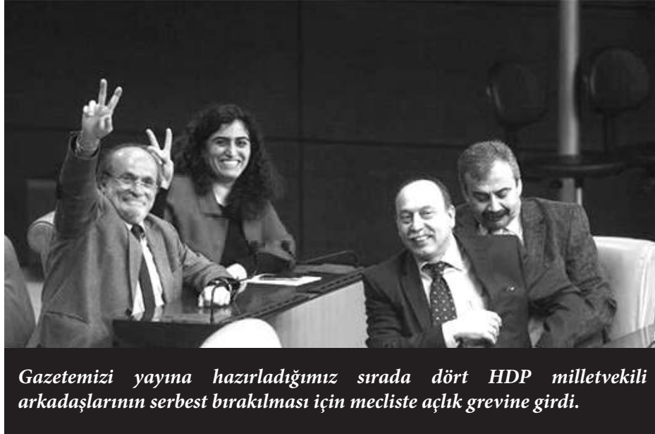
Gazetemizi yayına hazırladığımız sırada dört HDP milletvekili arkadaşlarının serbest bırakılması için mecliste açlık grevine girdi.

Boğaziçi Üniversitesi Uçaksavar Kampüsü Ayhan Şahenk Salonu'nda gerçekleşen konferansta öne çıkan başlıklar çözüm ve barış süreci, yerel yönetim anlayışı, katılımcılık ve demokrasi oldu. Murathan Mungan yaptığı konuşmada yeni bir toplumsal tasarımın hayata geçirilmesi için