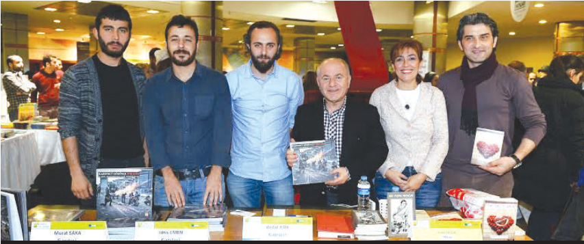
Kadıköy Belediye Başkanı Selami Öztürk (soldan 4.) ve Emel Seçen

K adıköy Belediyesi tarafından gerçekleştirilen 7'inci Kadıköy Kitap Günleri başladı. 72 yayınevinin okuyucuyla buluştuğu kitap günlerinde, yayınevleri tarafından belediyeye bağışlanan kitaplar Anadolu'da ihtiyacı olan kütüphanelere gönderilecek.