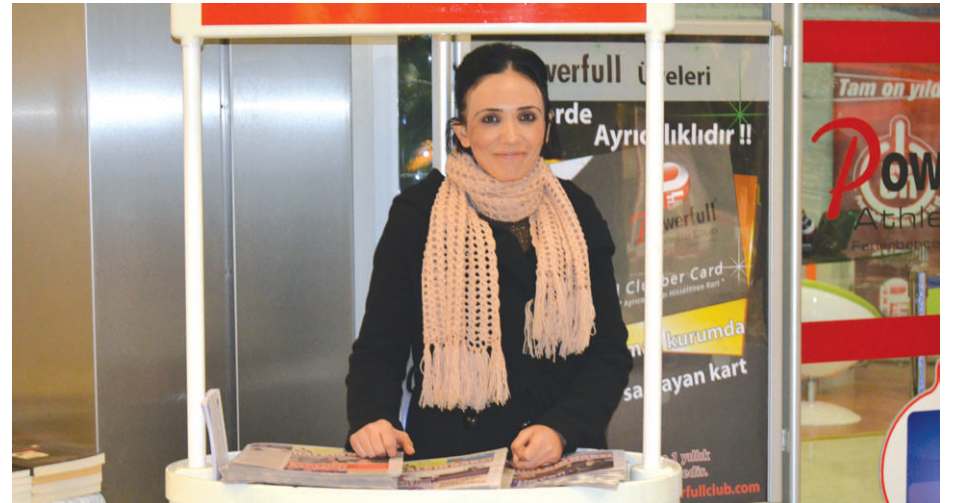
Halkın Habzı, CKM'de stand açtı.