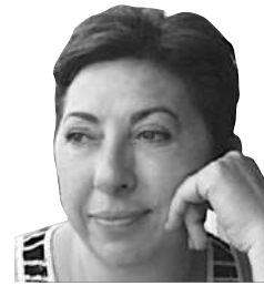
ANAP Eski Genel Başkanı İktisatçı