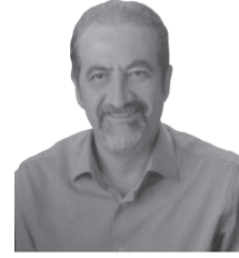
Genel Cerrahi Uzmanı İstanbul Tabip Odası Divan Başkanı