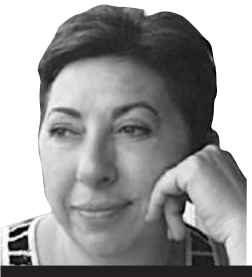
ANAP Eski Genel Başkanı / İktisatçı