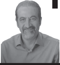
Genel Cerrahi Uzmanı İstanbul Tabip Odası Divan Başkanı