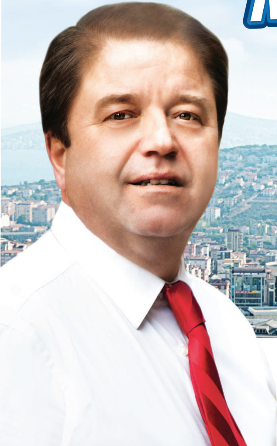
Ali KILIÇ Maltepe Belediye Başkanı