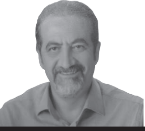
Genel Cerrahi Uzmanı İstanbul Tabip Odası Divan Başkanı