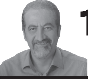
Genel Cerrahi Uzmanı İstanbul Tabip Odası Divan Başkanı