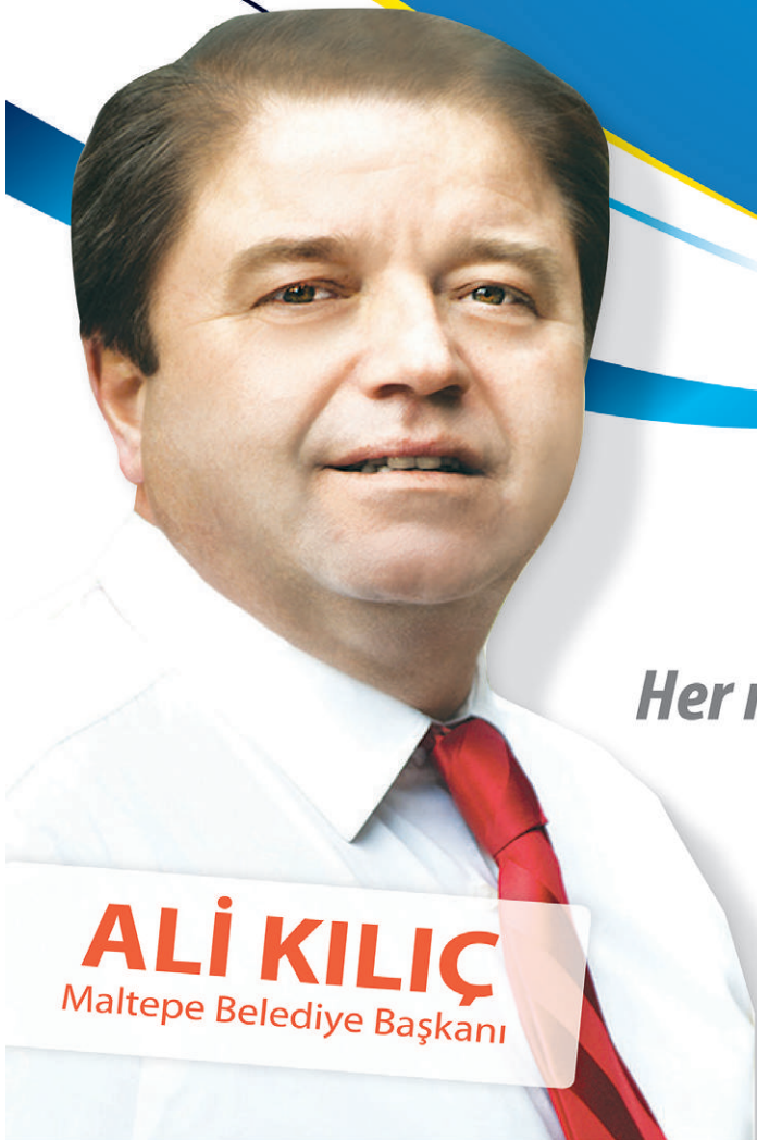
ALİ KILIÇ Maltepe Belediye Başkanı

Tarih: 27 Haziran 2014, Saat: 19.30 Yer: Maltepe Stadi