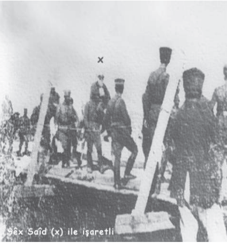
Birden Çok Azadi Var

T üm bu alıntılardan sonra şunu belirtmekte yarar var. Azadi'nin tek bir örgüt olmadığı ve birçok yerde şubeler biçiminde örgütlenen bir yapı olduğu açık. Ta başından beri çok gizli koşullarda örgütlenen bu yapının, özellikle 1921 Koçgiri İsyanı ile Dersim bölgesinde yaşanan zulümlere tepki olarak Türk ordusu içindeki Kürt subaylar ile aydın niteliği belirgin olan devlet kademelerindeki Kürt bürokratların ve öğrencilerinin girişimiyle kurulduğu ve kuruluşu ile ilgili bilgilerin daha çok güvenlik gerekçesiyle gizli kaldığı ve yaygınlaşmadığı açıktır. Yine de bilgileri bütünleştirerek, Azadi'nin kuruluş tarihinin 1921 yılına denk geldiğini söyleyebiliriz, ki diğer tarihler de doğrudur. Onlar da büyük olasılıkla Azadi'nin diğer şubelerinin kuruluş tarihleridir.