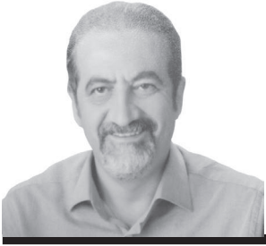
Genel Cerrahi Uzmanı İstanbul Tabip Odası Genel Sekreteri