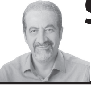
Genel Cerrahi Uzmanı İstanbul Tıp Odası Genel Sekreteri