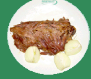
GERDAN FIRIN KEBAP