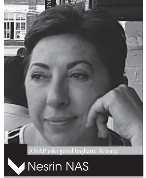
ANAP eski genel başkanı, iktisatçı

danışmanlık firması değişen insan kaynakları profilini belirlemek için yaptığı bir araştırmada, bizim kuşağı televizyon kuşağı olarak, ebeveynlerimizin kuşağını radyo kuşağı, yeni kuşağı da internet kuşağı olarak tanımlıyor. Devletin tek ses olarak yönlendirdiği radyo kuşağını yani ebeveynlerimizi 'itaatkar' ve devletin izin verdiği kadar bilgiyle ve haklarla yetinen bir kuşak olarak tanımlayan bu araştırmada, bizim kuşak da hem ebeveynlerinin hem de devletin kontrolünde olan tek sesliliğe yatkın ama farklı sesleri de duymaya başlayan, görevlerle haklar arasında denge kurmaya çalışan bir kuşak olarak tanımlanıyor. Yeni kuşak ise, internet sayesinde, hem devletin hem de ebeveynlerinin denetimi dışında, dünyadaki tüm bilgiye açık, mukayese yapma imkanları ve tercih hakkı sınırsız kuşak olarak tarif ediliyor. Bu kuşak için haklar tartışılmadığı gibi 'lütf' da değildir. On-